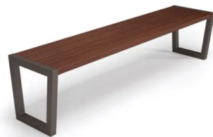
L_LAVIČKA Lavička bez operadla typ 11 bez operadla. Jej hlavnými prvkami sú oceľové profily, ktoré tvoria nohy a lamely sú z mäkkého dreva. napr.:ecoprogress.eu